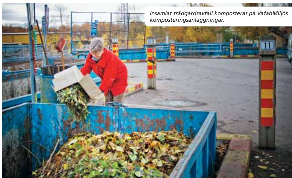
Insamlat trädgårdsavfall komposteras på VafabMiljö's komposteringsanläggningar.