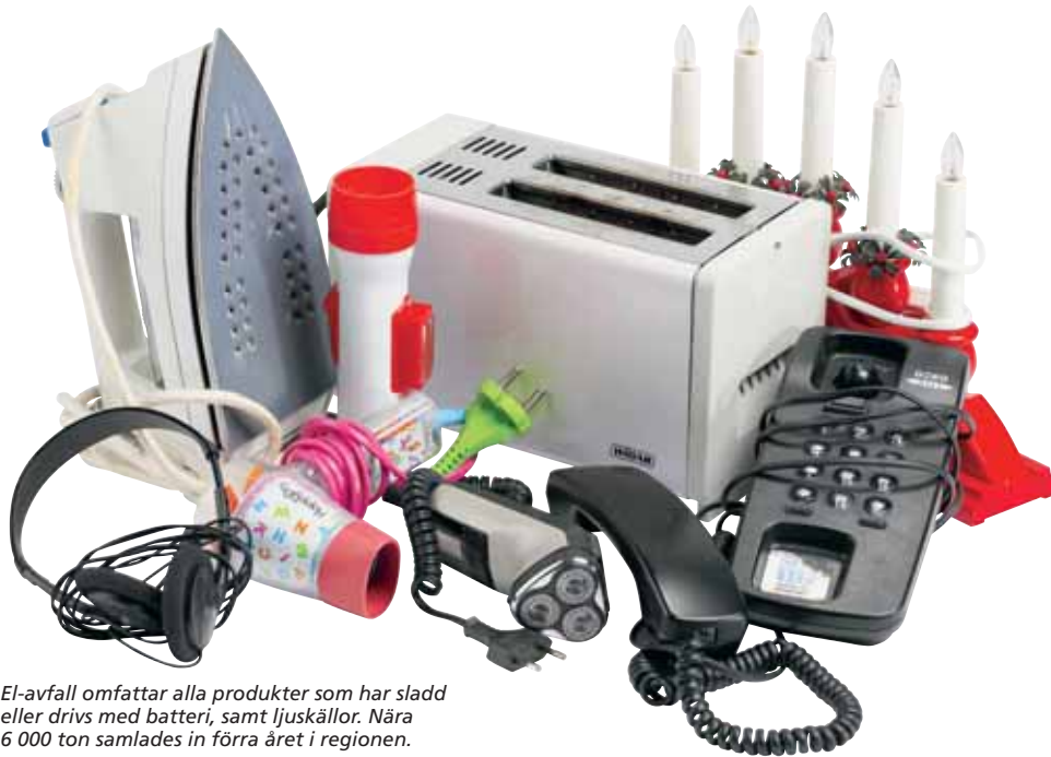
El-avfall omfattar alla produkter som har sladd eller drivs med batteri, samt ljuskällor. Nära 6 000 ton samlades in förra året i regionen.