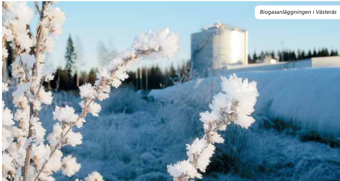
Biogasanläggningen i Västerås

VafabMiljö ägs av kommunerna i Västmanlands län samt Heby och Enköpings kommun.