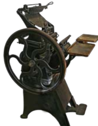
Gammal manuell tryckpress

fackligt ombud. Nyfiken, driftig och känner alla. "De får väl bära ut mig på bår", skrockar han.