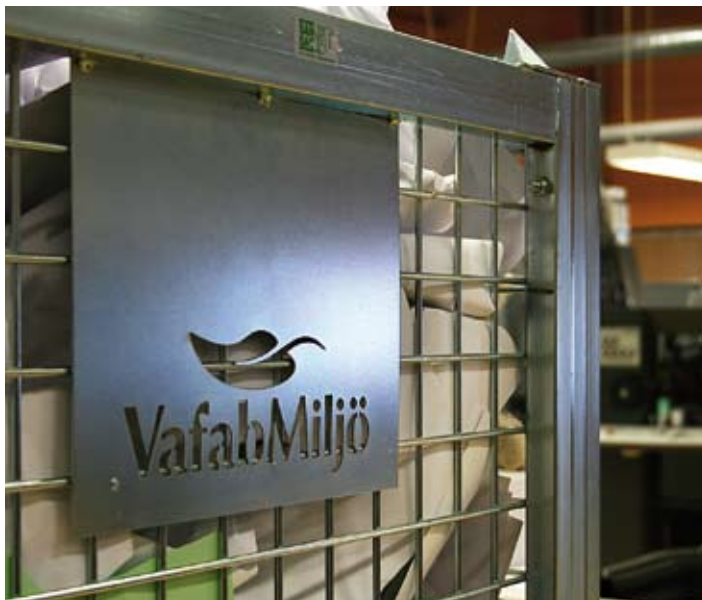
Edita lägger sitt pappersspill i burar som hämtas av VafabMiljö

Men om allt skulle berättas om skulle denna artikel bli en följetong. Så här tystnar tangenterna. Avslutar bara med att Edita ser fram emot ett bra samarbete med VafabMiljö där framtidsmål bland annat är att hitta bättre lösningar för färre transporter och önskemål om en kartong- och/eller plastkomprimator kommer på tal.