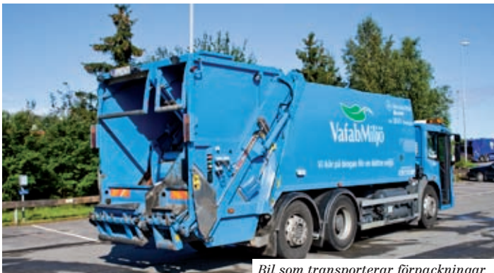
Bil som transporterar förpackningar.

VafabMiljö har containrar, kärl, komprimatorer m.m. för ditt avfall- och återvinningsmaterial. Kontakta Kundtjänst för information, beställning och prisuppgifter på tel 021-39 35 20.