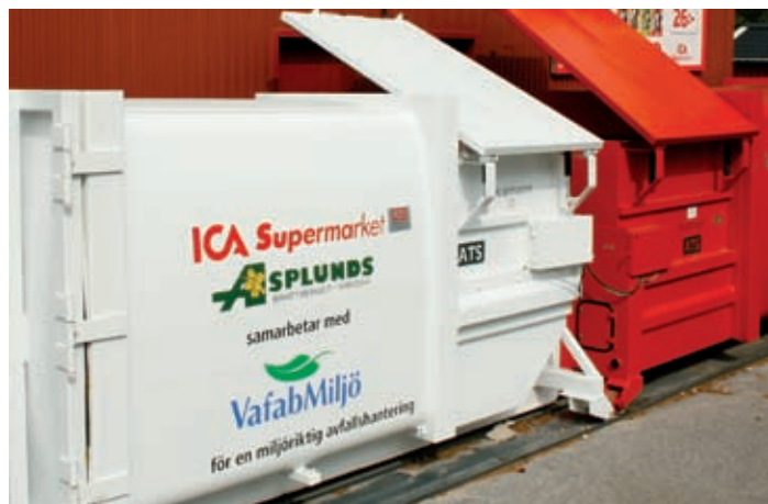
Komprimator utomhus passar för större industrier eller butiker med medelstora volymer av luftiga avfallsmaterial, förpackningsmaterial, t ex wellpapp.

Vill du läsa mer om VafabMiljös tjänster för företag är du välkommen att besöka vår hemsida på www.vafabmiljo.se . Klicka på Företag och klicka sedan på Våra tjänster.