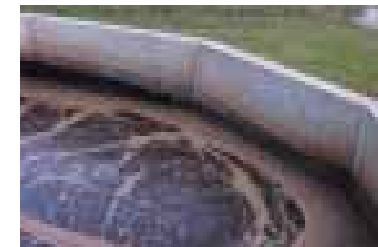
Efter tolv timmar pumpas lakvattnet ut till rotzonsanläggningen.