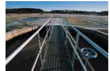
Behandlingen av lakvattnet sker i reaktorn under en tolvtimmarscykel.