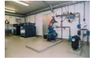
I maskinrummet finns blåsmaskiner och drivpumpar som syresätter och cirkulerar vattnet.

Från översilningsytan leds vattnet in i rotzonen genom ett filter av makadam och det samlas sedan upp i ett dräneringsrör, som leder till en utloppsbrunn. Härifrån leds sedan vattnet till en recipient i form av ett vattendrag.